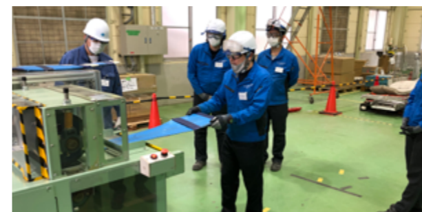
危険体感出張講座

本講座では、新たに4名が準講師に任命されました。各事業所における安全活動の率先垂範と、他の社員の実践をサポートする現地講師として活躍しています。